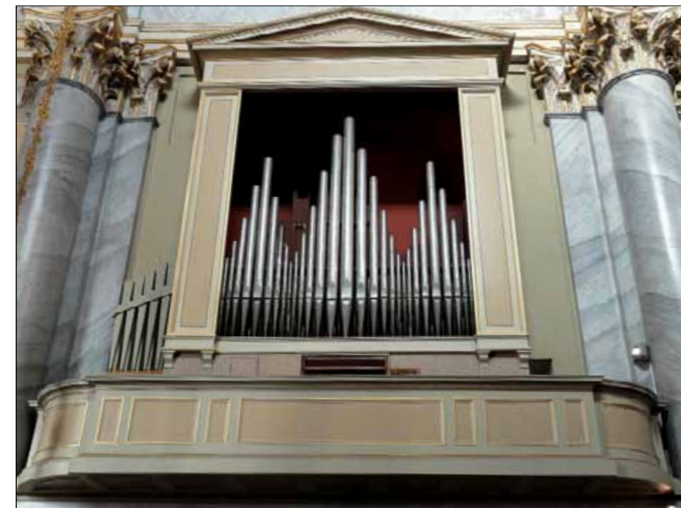
Qui sopra: la maestosa facciata dell'organo Lingiardi di Calcio (Bg), in presbiterio. Sotto, da sinistra: la consolle, con le manette dei registri, la pedaliera a leggio e le pedaleve; qui sotto: una veduta interna delle canne dopo il restauro e il complesso dei grandi mantici a cuneo.

L'organo di Calcio è il quarto "Lingiardi" restaurato in diocesi, dopo quelli di Sabbioneta (2001), S. Pietro al Po in Cremona (2008) e Commessaggio (2013). Altri attendono ancora di esse-