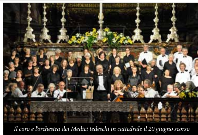
Il coro e l'orchestra dei Medici tedeschi in cattedrale il 20 giugno scorso

Molto bravi i cori coinvolti, nell'aver aderito con passione a questo progetto di studio e, in molti casi, di autentica riscoperta storica. Indimenticabile la con-